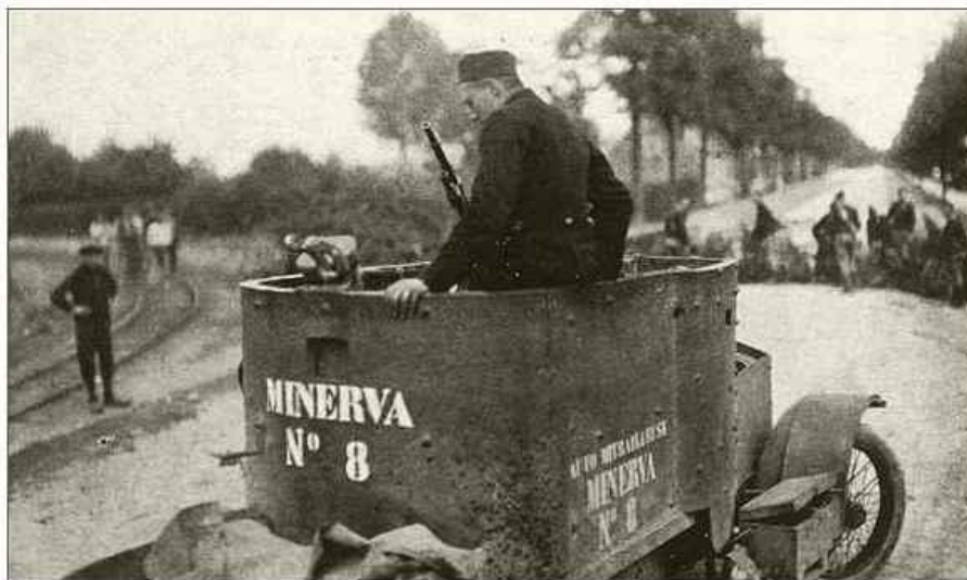
Belgian armoured motor-car going into action near Ghent. (Note the barricade in the background)

велосипедистов попала в засаду около Цebroва. Однако затем новости становятся приятнее: бронированный корпус первым занял Езерну и несмотря на сильный артиллерийский огонь закрепился в Зборове. Во время грандиозной церемонии в Езерне 104 бельгийца получили Георгиевские кресты.